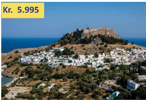
Lindos, den hvide by.