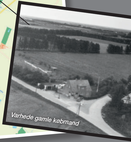
Varhede gamle købmand